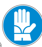
Protección obligatoria de las manos