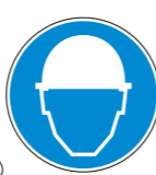
Protección obligatoria de la cabeza