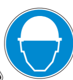
Protección obligatoria de la cabeza